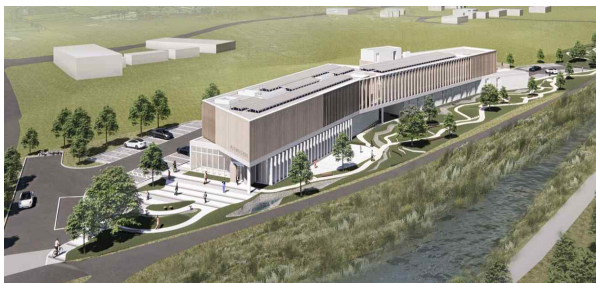
“기후변화대응 복합센터” 조감도